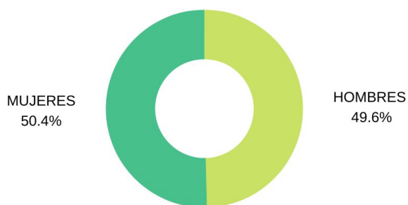
Distribución de asistentes en % según género.